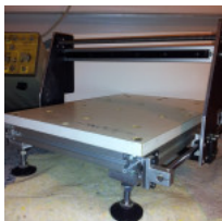
Sestavená frézka bez pohonů