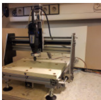
Vyrovnání a testování vřetene