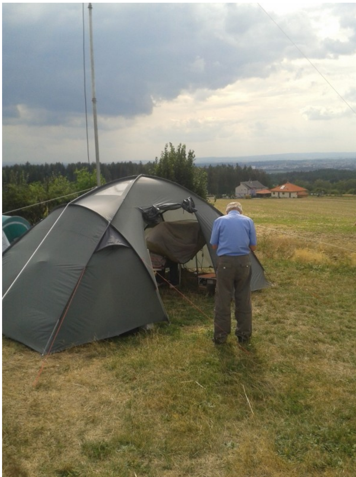
OK2UWJ jde zachránit OK2PYD