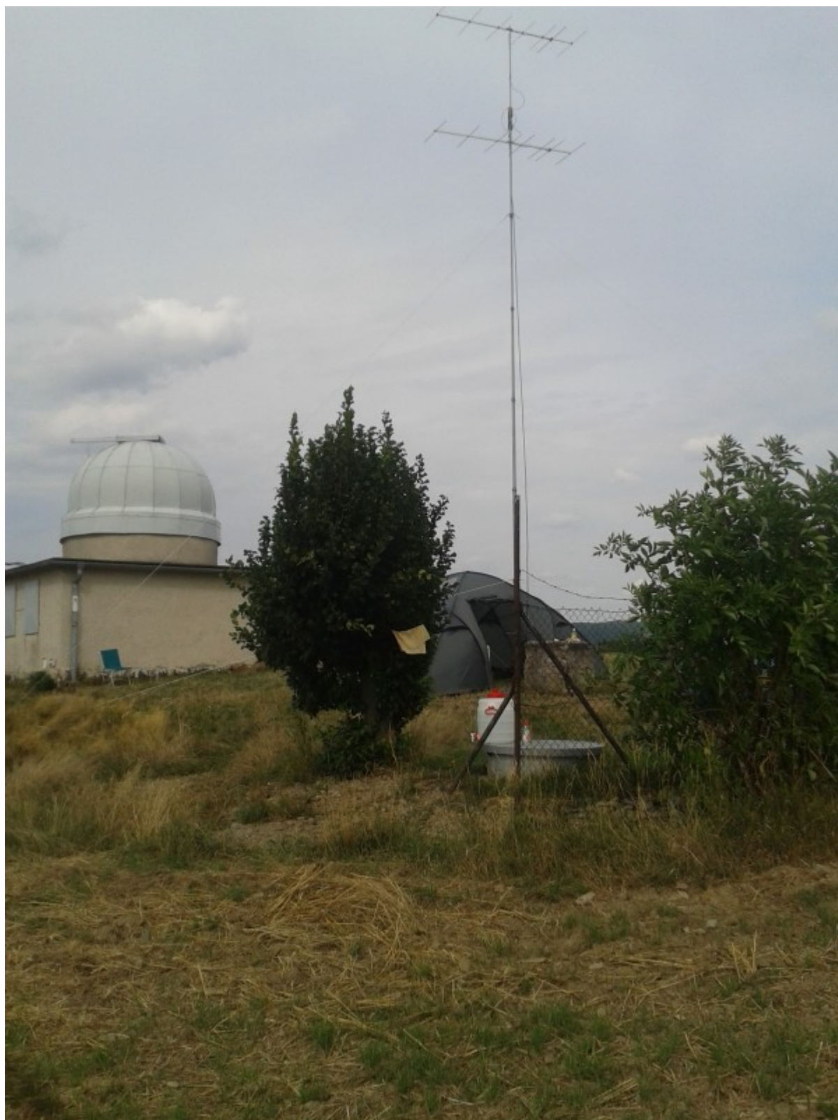
QTH Hvězdárna Lošov