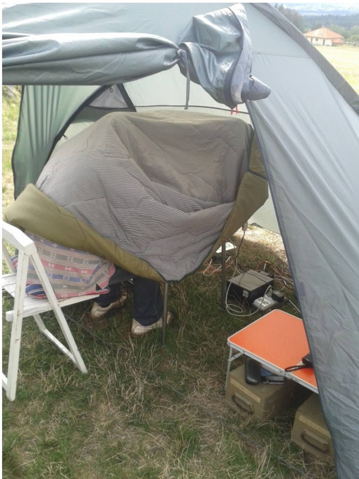
OK2PYD loví vzácný DX